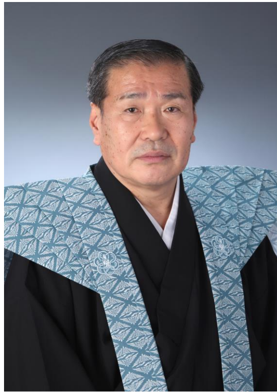
たけもと しろだゆう 竹本鋳太夫